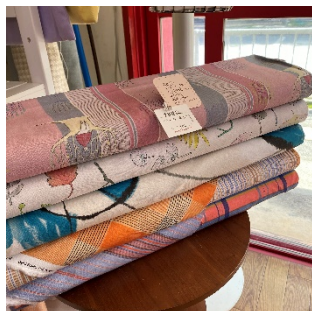
NUNU に新しいコレクションが 仲間入りしました！ 110c 幅 綿 100% ￥1,900/m

1年あっという間に過ぎていくのに、 オリンピック・パラリンピックはずいぶん前のような気がします。 時間の感じ方は本当に不思議です。80歳になる母に、私の歳の頃より更に速く感じると聞き、ちょっと怖くなりました (笑) 今年もまた、やり残したこと、やり終えたこと、焦りと反省の1か月です ( ^ _ ^ )